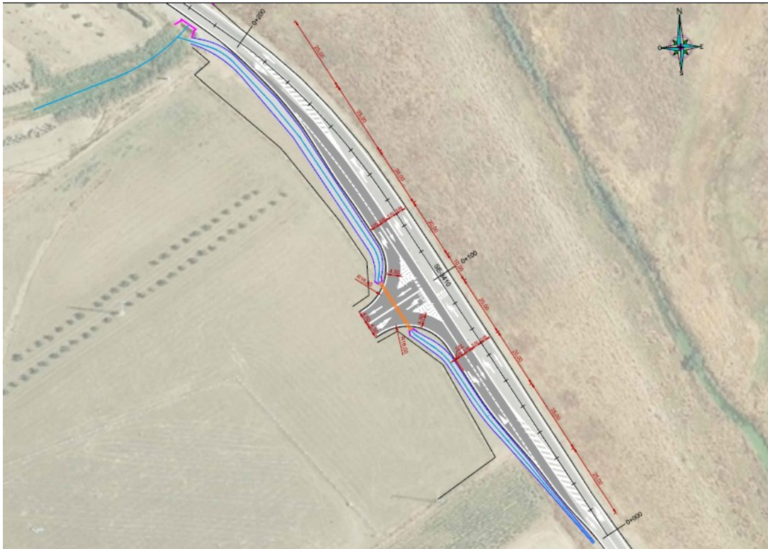
Imagen 1: Plano de las actuaciones

3.- En el proyecto presentado se plantea la realización de los siguientes trabajos: